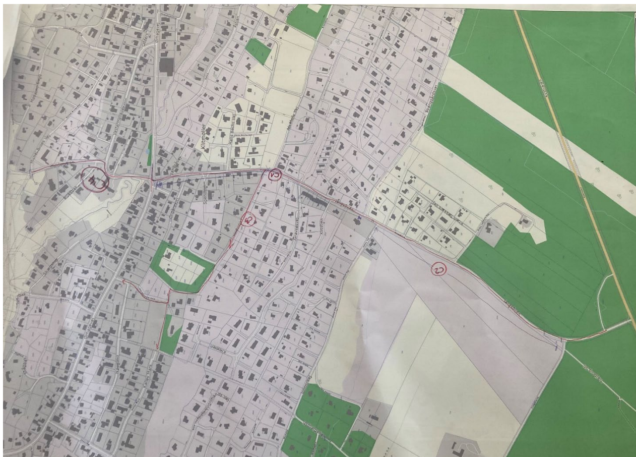
Lokalisering Udfordringer – Vangsåvej til Tolderstien