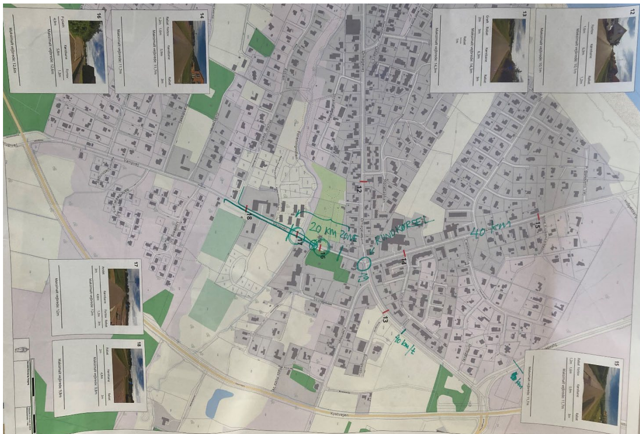
Lokalisering Løsninger – Vangvej og Krovej