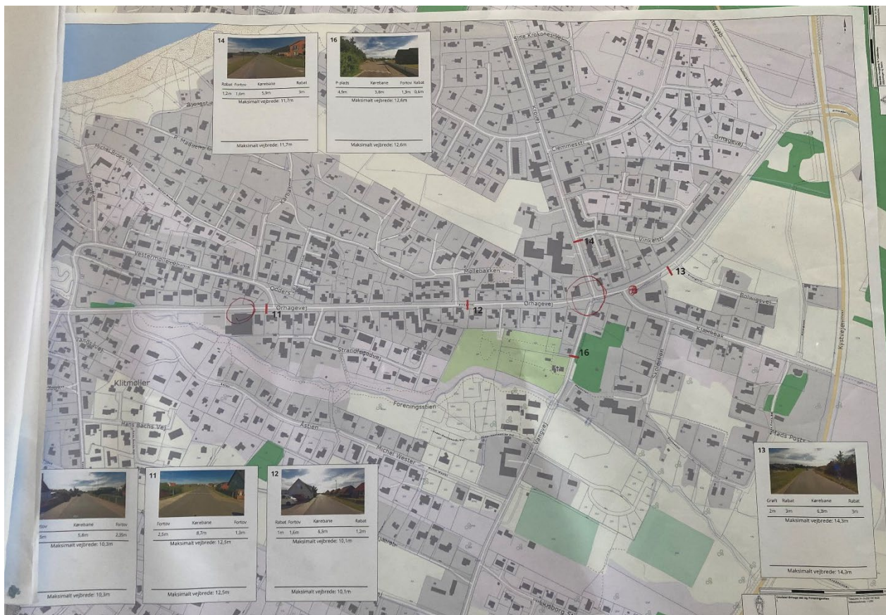
Lokalisering Løsninger – Ørhage Øst