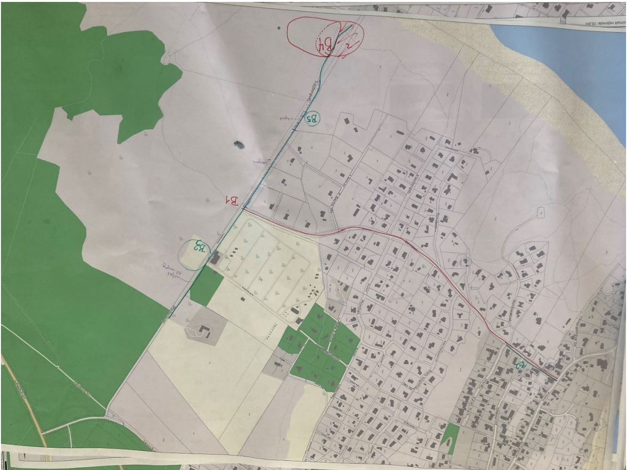
Lokalisering Udfordringer – Bavnbak til Trøjborgvej

Opsamling Workshop trafik, den 3. november kl. 17 – 20.30