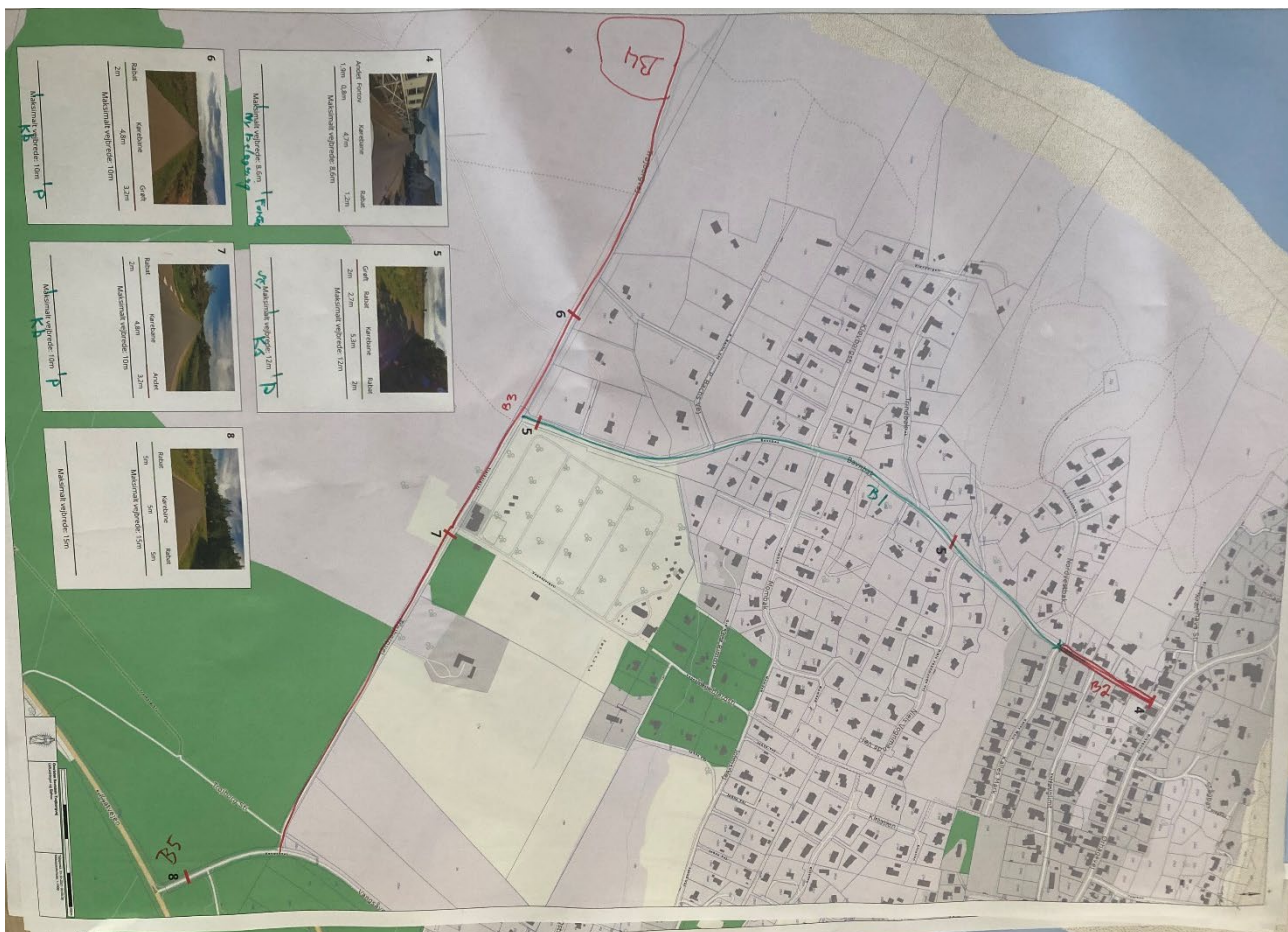
Lokalisering løsningsforslag – Bavnvej til Trøjborgvej

Vi hepper på alternative mobilitetsløsninger som skatere og el løbehjul.